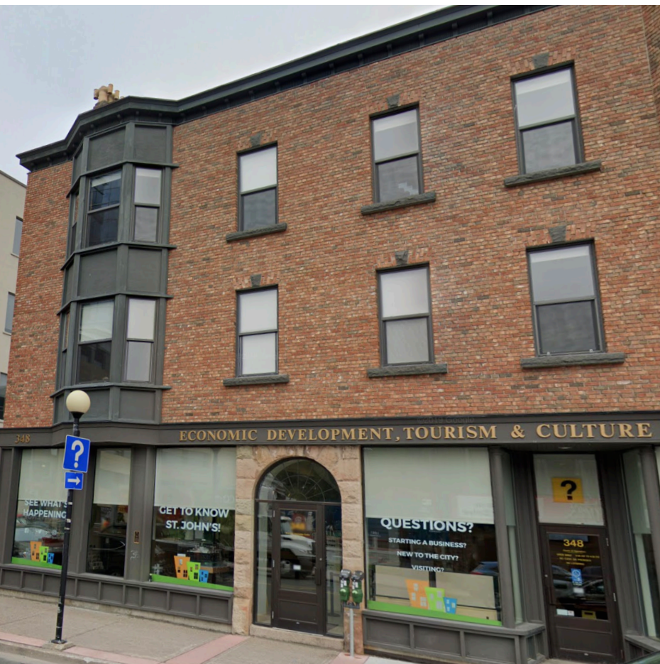
348 rue Water

Selon le type d'entreprise que vous souhaitez exploiter, d'autres organismes au niveau provincial ou fédéral peuvent être impliqués. Utilisez PerLE.ca pour déterminer si des permis ou des règlements propres à votre secteur d'activité s'appliquent à votre entreprise.